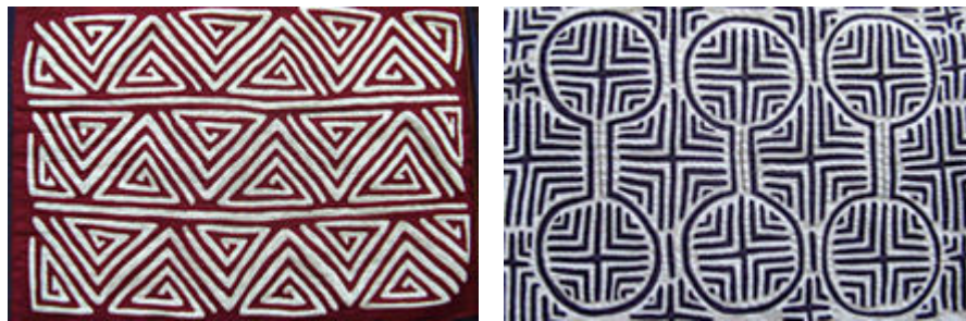
Los caminos del arte Kuna, los caminos de la vida

Uno de los elementos de las molas muy significativo es su dualidad (están constituidas por dos fases), tema importante para muchas sociedades amerindias. Según las creencias de los indios Kuna, todos los seres tienen su purba (doble, esencia oculta, alma): los seres humanos, los animales, las plantas, los objetos, etc.