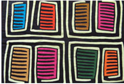
Dualidad y el cruce de diferentes culturas

Uno de los elementos de las molas muy significativo es su dualidad (están constituidas por dos fases), tema importante para muchas sociedades amerindias. Según las creencias de los indios Kuna, todos los seres tienen su purba (doble, esencia oculta, alma): los seres humanos, los animales, las plantas, los objetos, etc.